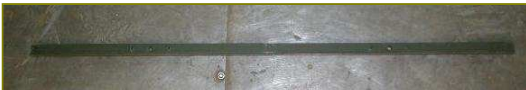
Traverse supérieure de pare-brise de Jeep au prix de 21 € HT 25.11 TTC