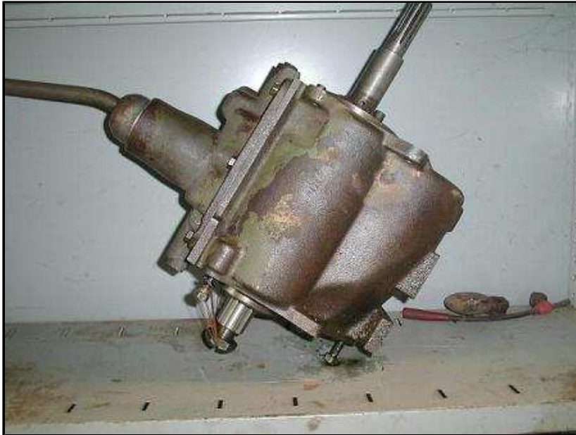
Boîte de vitesse M38 au prix de 700 € ht