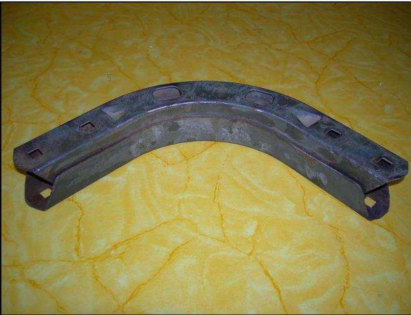
Coude d'arceau adaptable pour Dodge Prix : 22 € HT Quantité disponible : 12 pièces