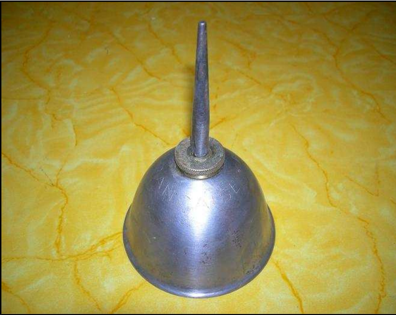
Burette d'huile Prix : 5 € HT PROMO 4 € HT