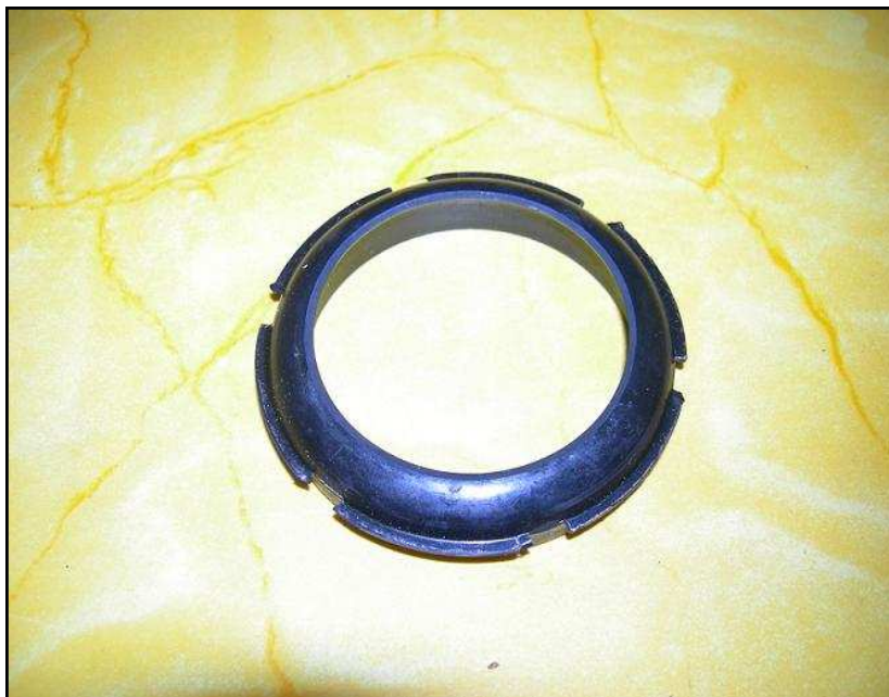
Joint Spi écrou moyeu arrière Banjo pour GMC Prix : 15 €HT