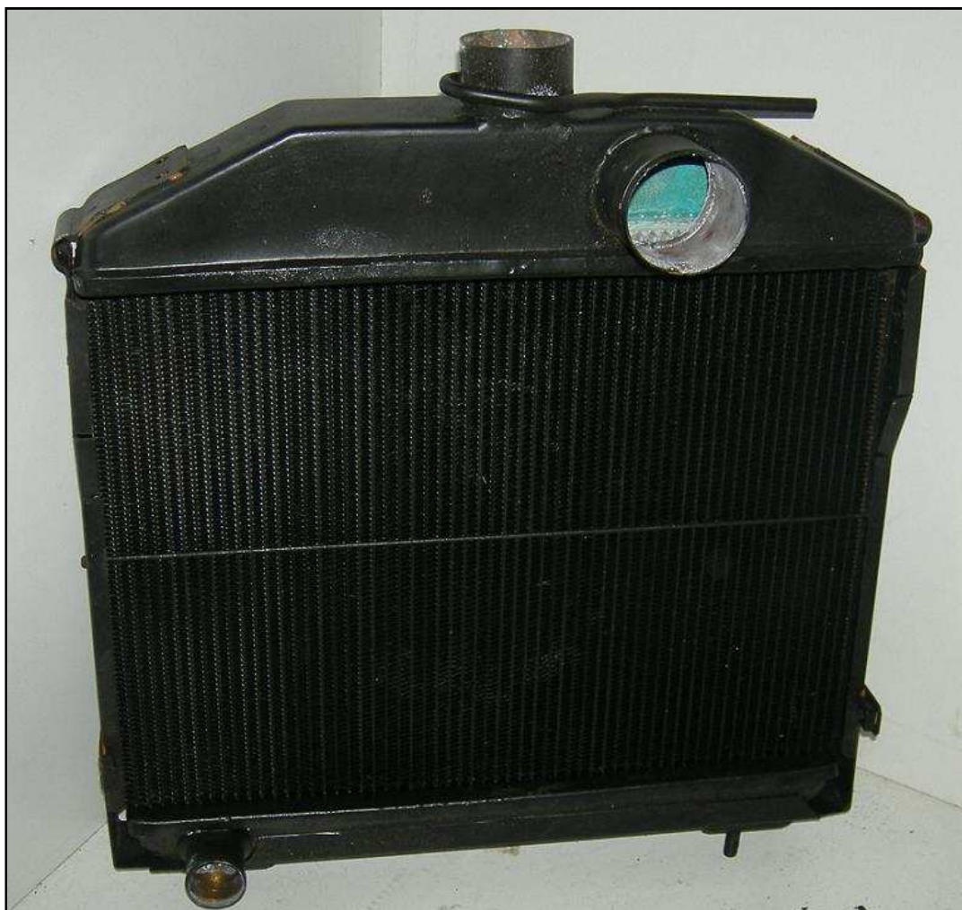
Radiateur R2087 neuf Prix : 220 €HT