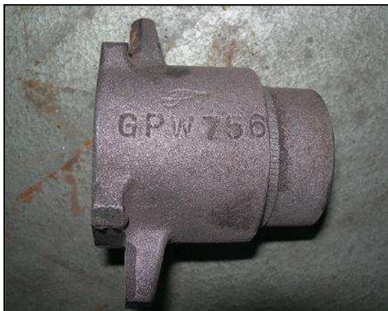
Support butée d'embrayage Ford 35 € HT (Exemplaire unique)