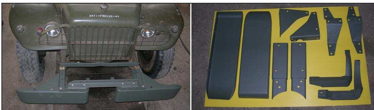
Kit d'allongement pour le treuil pour votre WC 51.