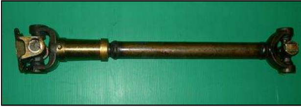
Arbre de transmission arrière Jeep 69 €HT