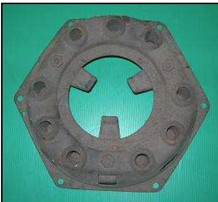
Mécanisme embrayage Dodge : 120 € HT PROMO 99 €HT