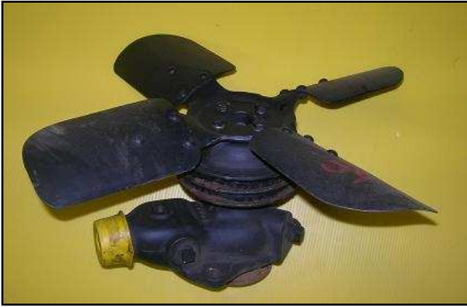
Pompe à eau 24 V Jeep : 60 € PROMO 49 €HT