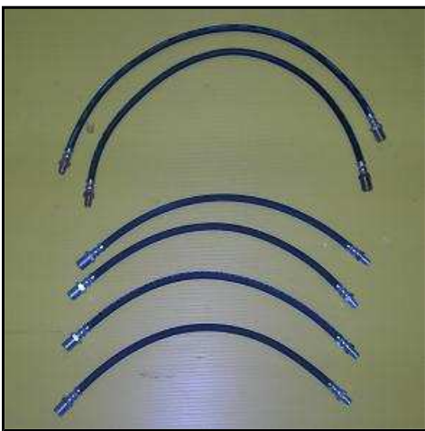
Kit flexible frein GMC (jeu de 6) : 60 HT PROMO 49 €HT