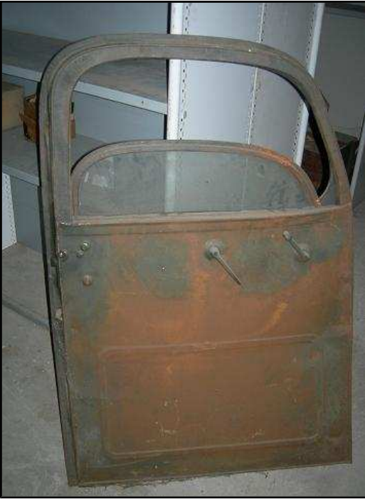
Porte avant gauche GMC 130 € HT PROMO 110 €HT