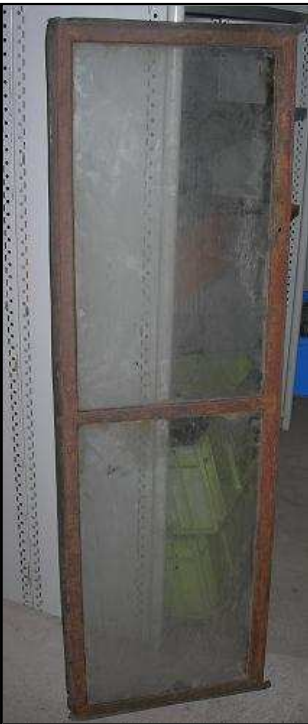
Pare-brise avec glace Dodge 190 € HT PROMO 152 €HT