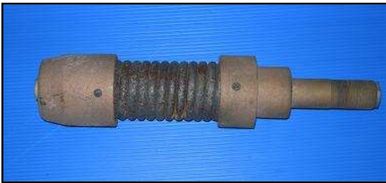
Embase antenne MP37 JEEP 50€HT Promo 39 €HT