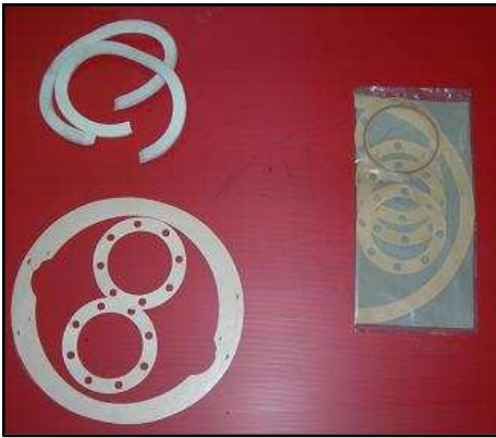
Kit pochette de joint pont avant et arrière banjo GMC 25 €HT Promo 19 €HT