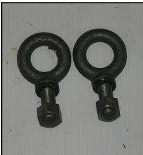
Anneaux de crochet arrière DODGE 25 €HT Promo 19 €HT