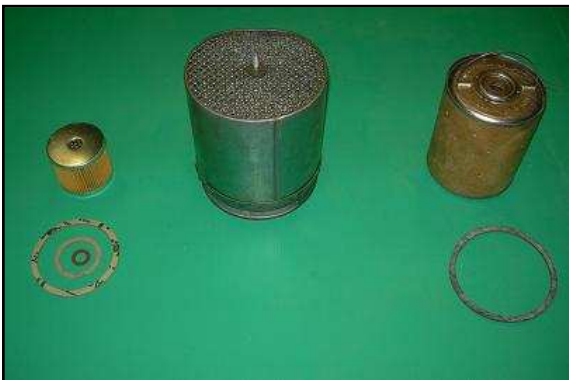
Kit révision JEEP comprenant : 1 Cartouche Filtre à huile + joint, 1 Cartouche filtre à essence + pochette de joints, 1 Cartouche filtre à air US 71 € HT offre spéciale 49 €HT