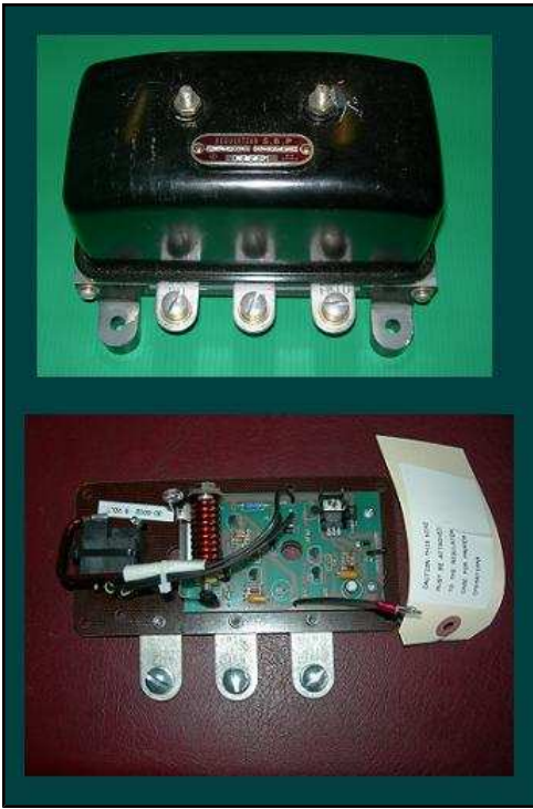
Régulateur électronique 6V 360 €HT