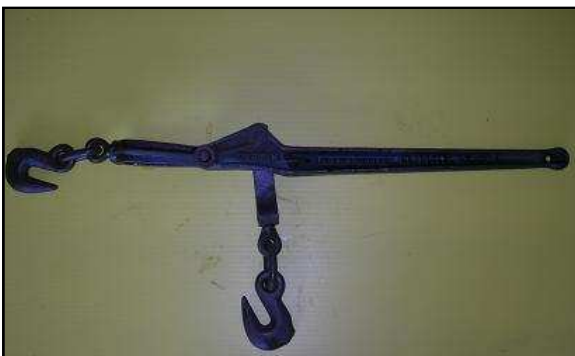
Qui pourra découvrir ma fonction ?