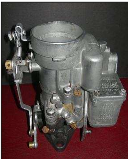
Carburateur Carter reconditionné 250 €HT