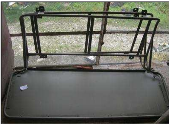
Armature de siège Command Car Avant 760 €HT Armature de siège Commanc Car Arrière 500 €HT