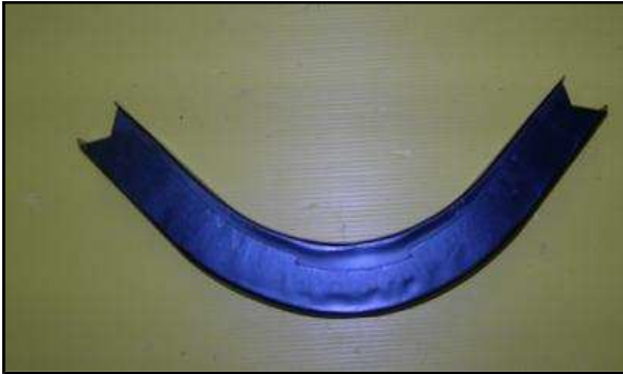
Coude d'arceau Dodge neuf 30 €HT unitaire (quantité limitée à 15 pièces)