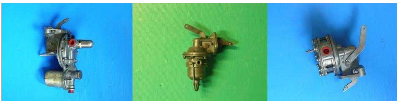
Pompe à essence DODGE 2 valves