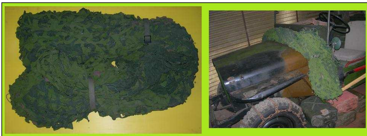
Filet de camouflage feuille NOS 5M x 5M 150 € HT Promo 119 € HT