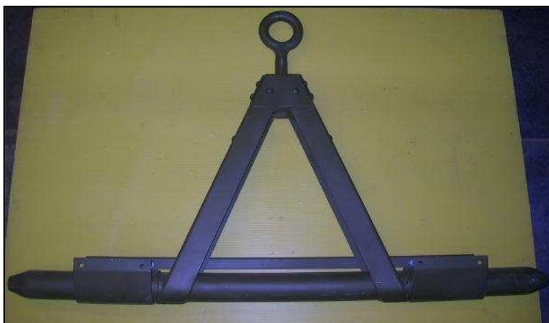
Crochet d'attelage avant Jeep 600 €HT