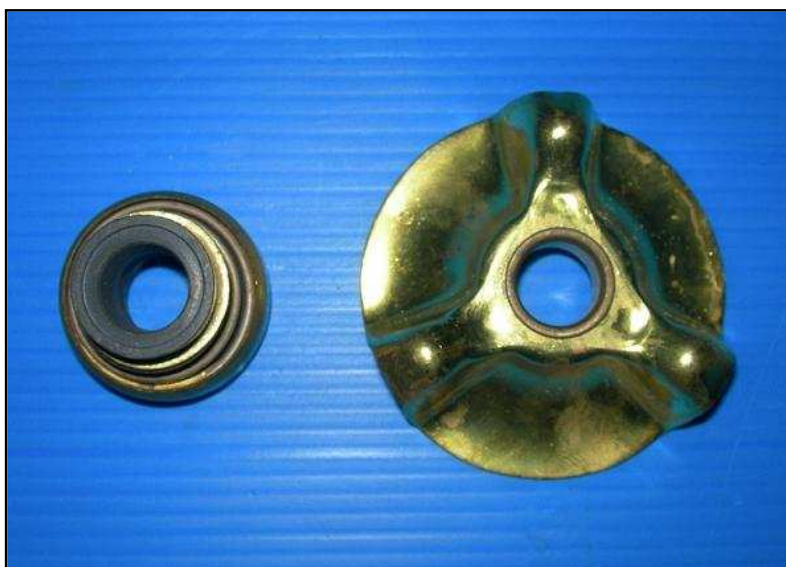
Turbine + Joint étanchéité pompe à eau R2087 45 € HT Promo 39 € HT