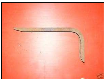
Support avant d'aile Dodge NOS 20 € TTC