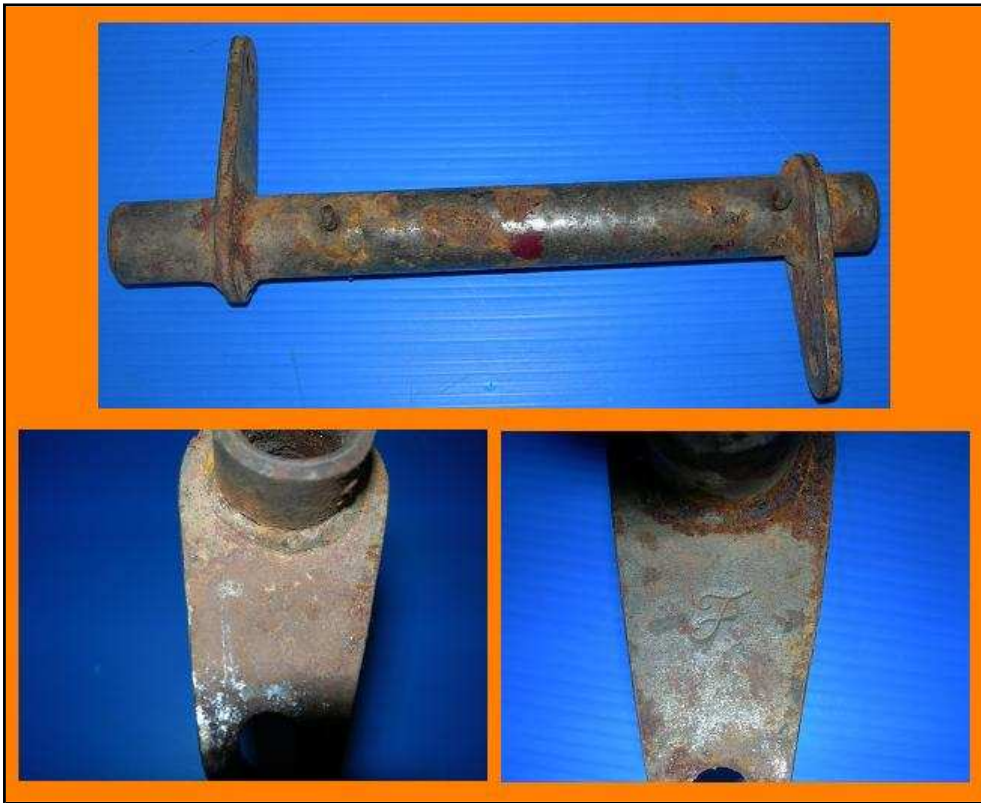
Axe palonnier commande embrayage Jeep