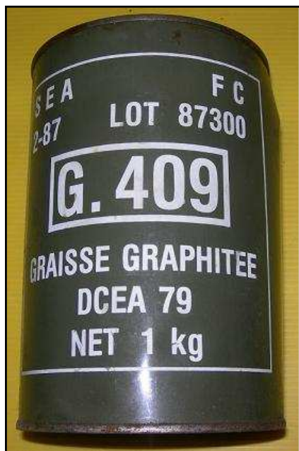
Graisse graphitée, origine armée Française (pot de 1 Kg)