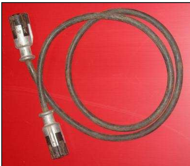
Rallonge prise de remorque Mâle Mâle JEEP 39 €TTC