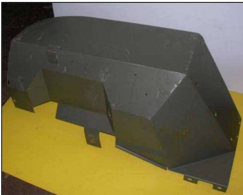
Aile avant droite NOS Jeep 90€HT