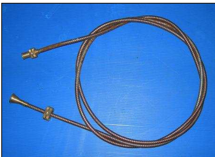
Gaine de cable compteur Dodge 6x6 NOS 15€HT