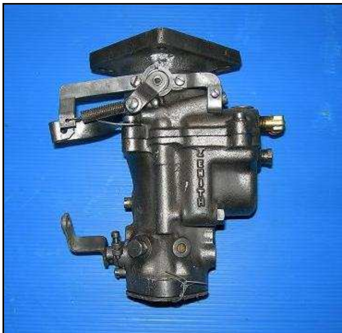
Carburateur Zénith à bride carrée reconstruit GMC 350 €HT